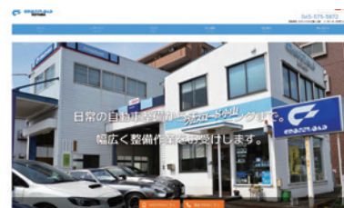
(令和7年5月リニューアルサイト) ホームページ制作例:株式会社クロスロード小山様