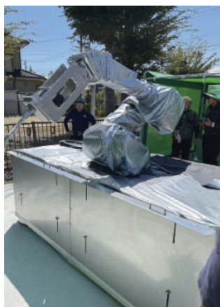
自動走行ロボット 橋梁用 (左)、道路用