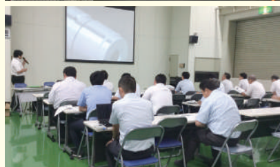
毎週のメーカー勉強会