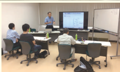
月1回 無料開催の NC スクール