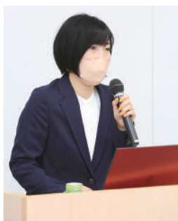
さまざまな特性を持つお客様をお迎えするための法人向け講演を実施