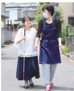
日本視覚障がい者美容協会活動の一環で障害者へサポート対応を行う