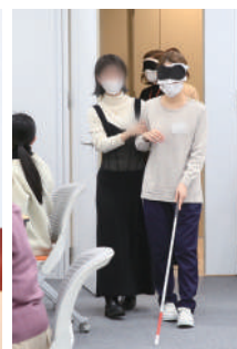
障害者への「合理的配慮の提供」に対応する研修を開催