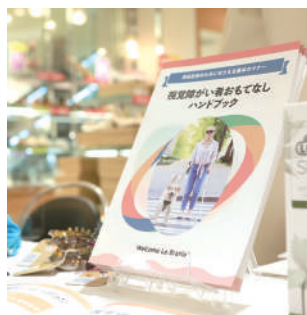
日本視覚障がい者美容協会発行「視覚障がい者おもてなしハンドブック」を販売