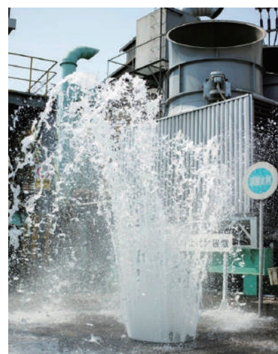
鉄蓋内圧解放試験の様子

現在設置されている鉄蓋の約20%が現代に必要とされている機能がない、あるいは耐用年数を超えているなど、安全でない鉄蓋が日本国内に350万基ほどあります。弊社は事故を未然に防ぐための計画的な維持管理と、交換工事をサポートします。