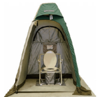
災害用トイレ「エペットさん」