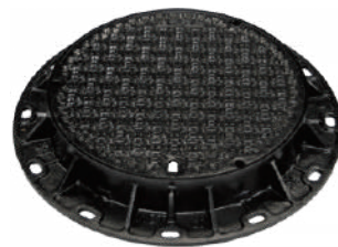
次世代軽開放型グラウンドマンホールNCT

主に上下水道用鉄蓋（マンホール）を中心に鑄物製品の製造を行っています。同社の製品は、まちのライフラインを支える重要な部品として、国内外問わず使用されています。創業80周年を迎え、さらなる「安全・安心」と「長寿命化」を目指した製品の開発に注力しています。