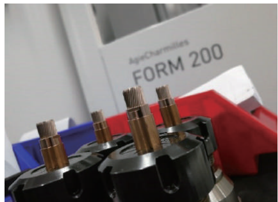
型彫り放電加工機と電極

日本国内でも数少ない5軸フェムト秒レーザー加工機を保有し、あらゆる素材への微細加工を行っています。他社では難しい微細加工も対応可能です。