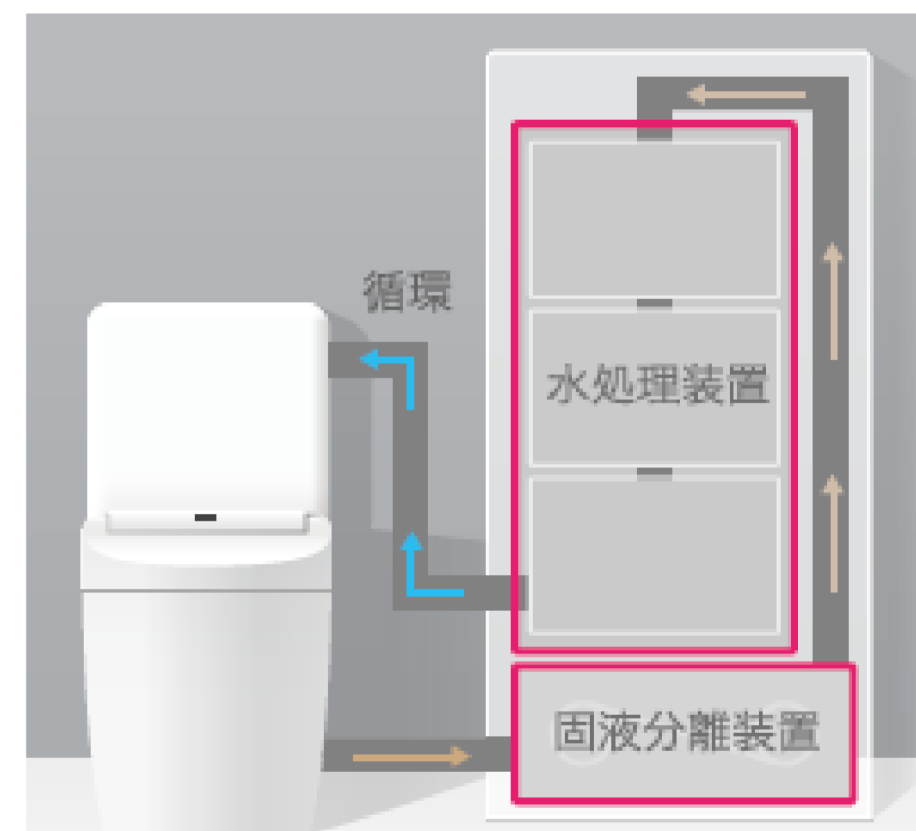
右図: 家庭の水洗トイレと組み合わせた 水再生装置e6s

水再生装置e6s と組み合わせることで、あらゆる水洗トイレが電気や上下水道に依存しない 持続可能な水洗トイレ に生まれ変わります。