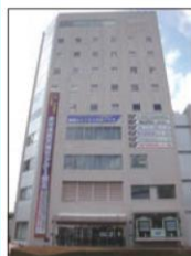
▲新都心ビジネス交流プラザ3階

URL : http://www.saitama-j.or.jp/sangaku/