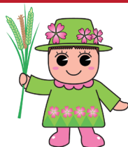
戸田市マスコットキャラクター 「とだみちゃん」