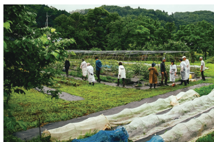
地元の農業経験者が講師を務める農業体験イベントは、今後企業向けにも展開予定