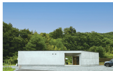
設計士の夫と建物の設計から内装まで2人で手掛けた