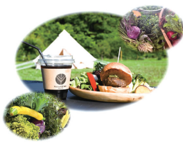
無農薬の自家製野菜を中心に提供し、コーヒーは地元の銘水「毘沙門水」を使用