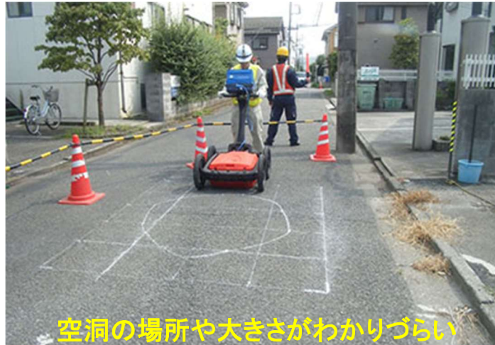
工事写真例