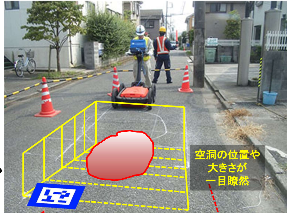
特許を応用した路面下レーダー探査結果確認方法