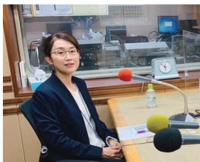
メディア出演する際には、広報PRへの思いや可能性を伝えている