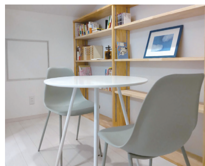
お客様の話をヒントにメディアの方に興味をもってもらえるネタを探す