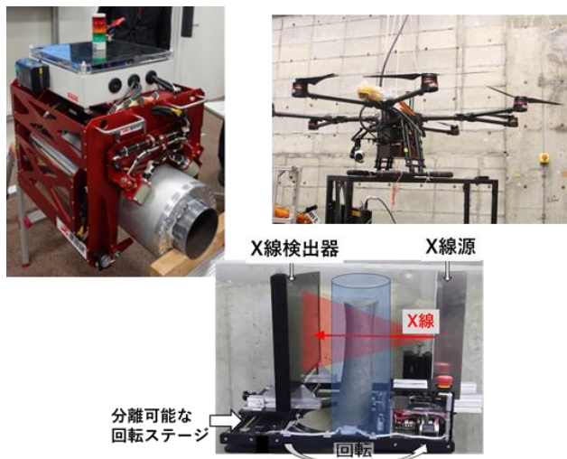
ロボットを利用したX線非破壊検査システム