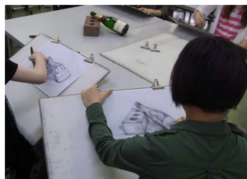
デジタルドローイングの様子

本システムを美術の専門校で正規導入を行なった結果、従来のドローイングの授業と比較して学習者のドローイングスキルの獲得が1ヶ月程度早まりました。