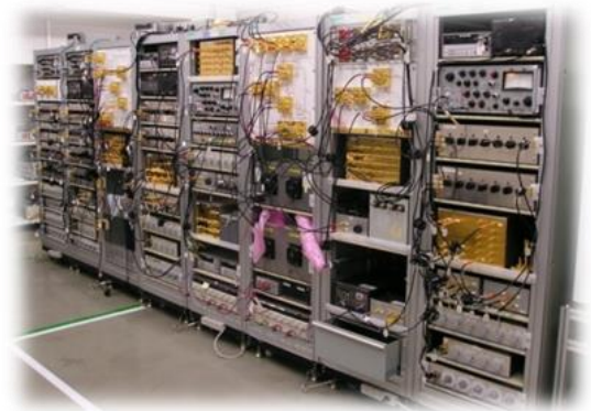
キャパシタンスブリッジ