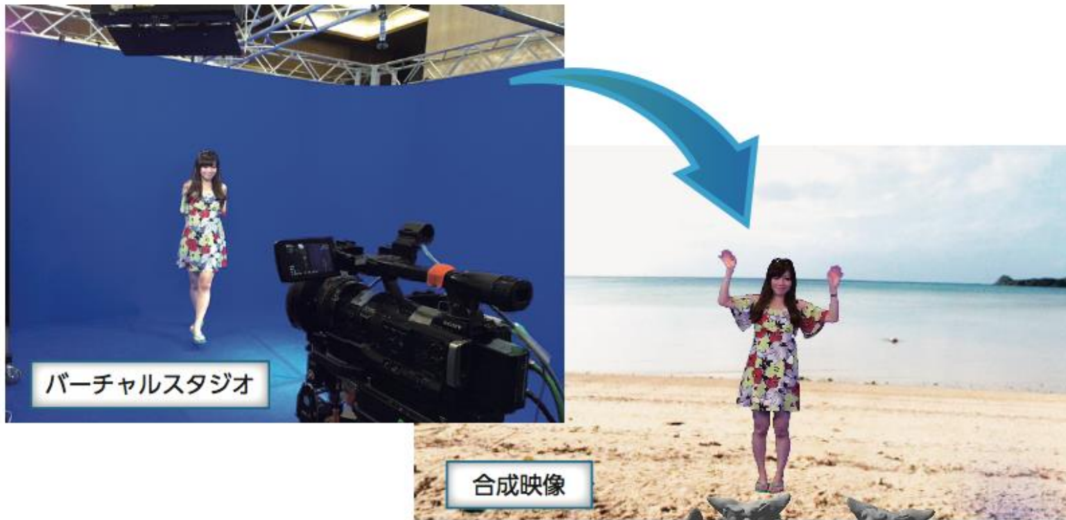
簡易バーチャルスタジオシステムを利用した合成映像の例