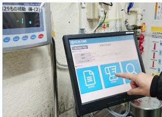
電子秤と連携したミスのない塗料調合

また、経産省が監督するIT導入補助金2020のITツールに認定されたので、導入していただくとき政府の補助金を申請することもできます(補助金の採択には審査があります)。