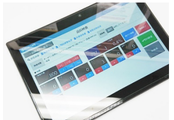
検査結果のリアルタイム集計

久保井塗装株式会社 事業内容: 工業塗装 資本金(万円): 5300万円 電話: 04-2958-5763 E-mail: dev@kuboitousou.co.jp