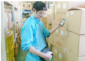
受注と塗料・素材・製品の在庫を連動