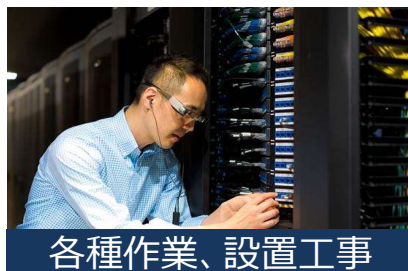
各種作業、設置工事