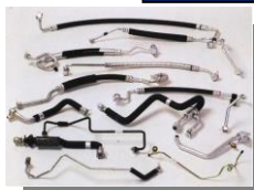
カーエアコンホース・パイプ