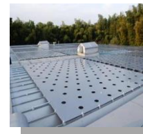
屋上遮熱シート 「冷えルーフ」