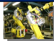
産業用ロボット用部品