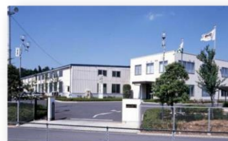
熊谷事業所 (ホース・パイプ事業部)