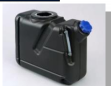
SCRシステム用 尿素水タンク