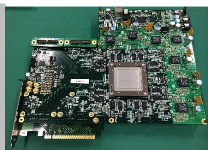
高速デジタル基板