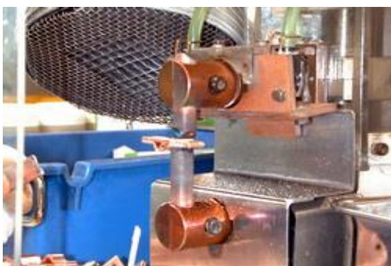
電気抵抗 銀ロー付