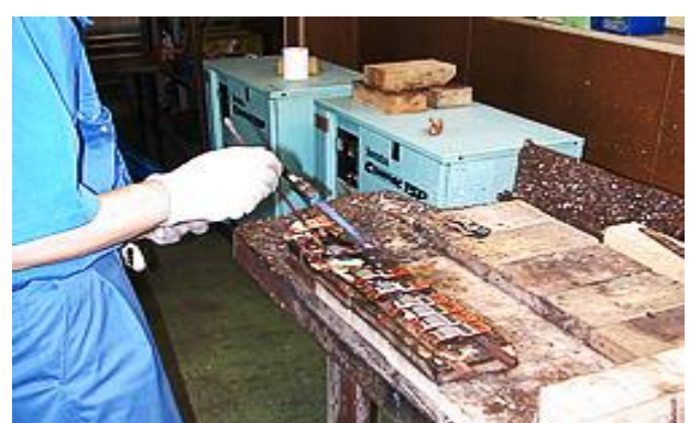
トーチ（ガスバーナー）銀ロー付