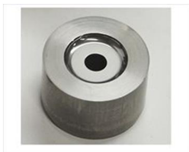
ベアリング部品用金型