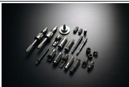
精密鍛造ギア付き部品