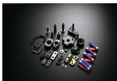
温・冷間鍛造マウント部品