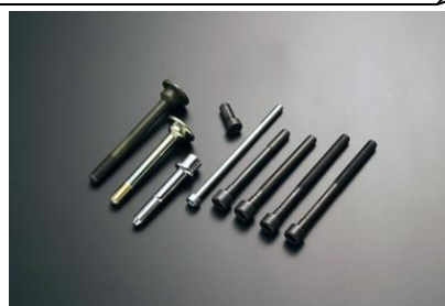
高機能、高強度ボルト