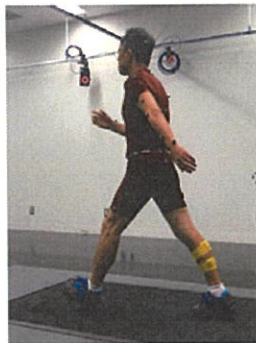
特殊な運動用シューズ