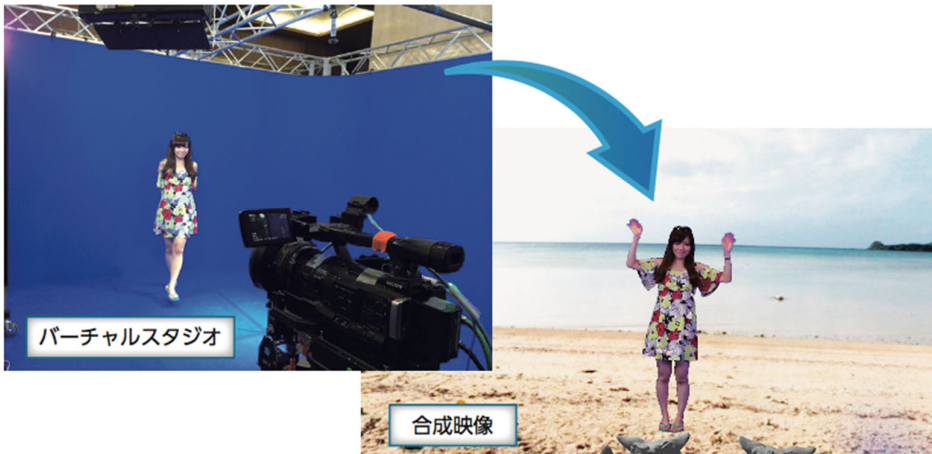
簡易バーチャルスタジオシステムを利用した合成映像の例