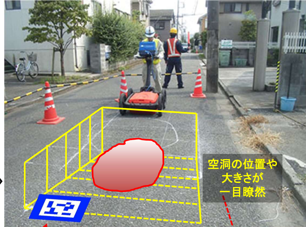
特許を応用した路面下レーダー探査結果確認方法