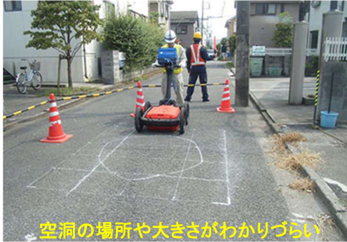
工事写真例