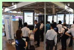
分析技術 展示会 「JASIS」