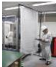
レーザー 遮光カーテン