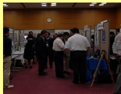
茨城県 技術展示会