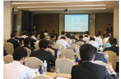
タイネットワークセミナー