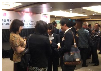
インドネシアネットワーク設立式・交流会