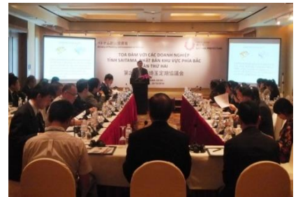
定期協議会(ハノイ)