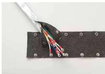
遮熱断熱チューブ