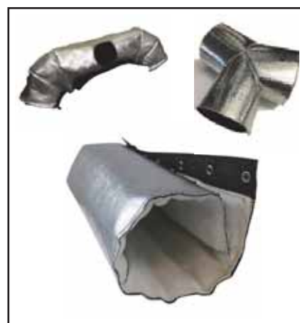
遮熱断熱のカスタマイズ品