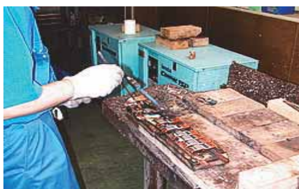
トーチ（ガスバーナー）銀ロー付