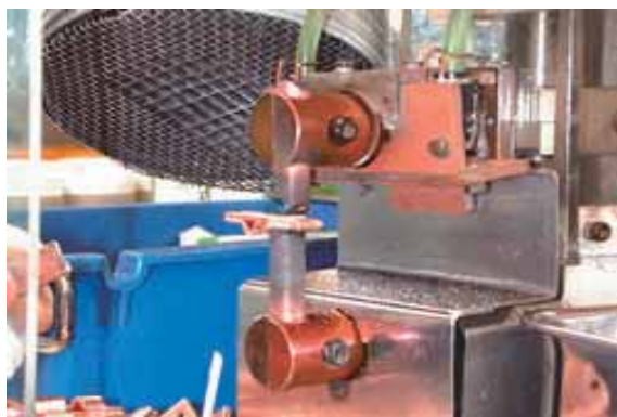
電気抵抗 銀ロー付