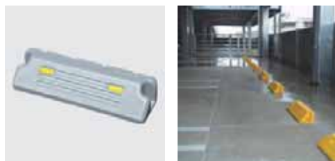
プラオートブロック

当社製自動車積載用 LED 非常信号灯は 2007 年第 20 回日刊自動車新聞用品大賞を受賞し、これまで累計 1 千万本納入、シェアは9割を超えます。今後は新車用標準装備品としての納入も増え市場需要の拡大が期待されています。また他にも鉄道用信号灯など特殊な LED 照明器具を供給している業界のリーディング企業です。