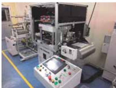
カメラ付プレス機