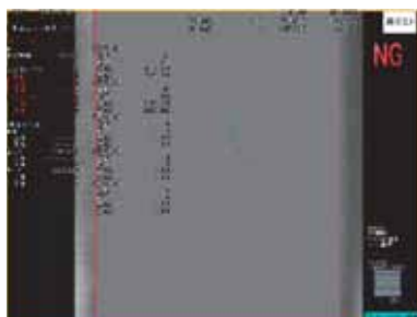
画像検査(検査画像例)