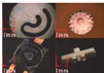
小型・超精密成形部品