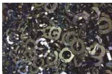
焼結部品への無電解ニッケルめっき

数ミクロンの膜厚差で性能に差が出る精密部品に採用されており、めっきの膜厚を 9 \pm 2 \mu\text{m} で制御することが可能です。量産ラインも保有しており、数十万個/月の処理も可能です。