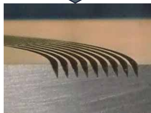
加工断面形状(被切削材:NAK55)

上記形状以外にも ご希望の断面形状での切削が可能です。 一度お問い合わせくださいませ