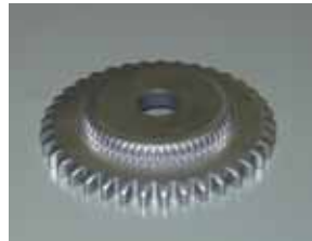
二部品 一体化成形