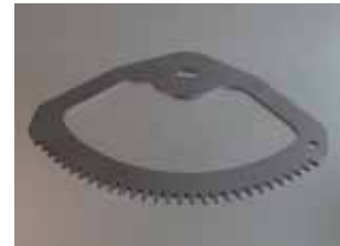
FB加工特性による 熱処理廃止