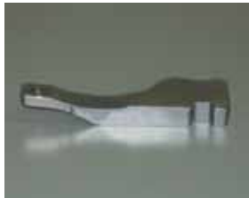
鍛造+切削からの 工法転換