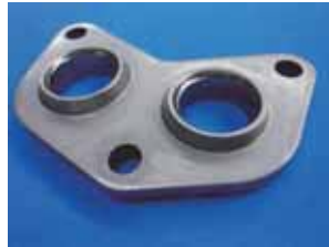
高くて厚い リブ成形