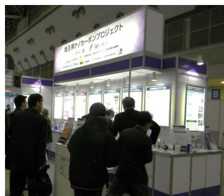
昨年度の成果発表 (nanotech2019出展)