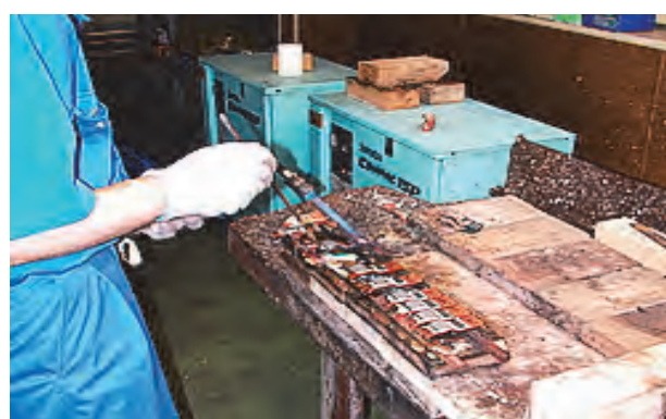
トーチ（ガスバーナー）銀ロー付