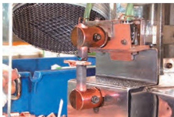
電気抵抗 銀ロー付