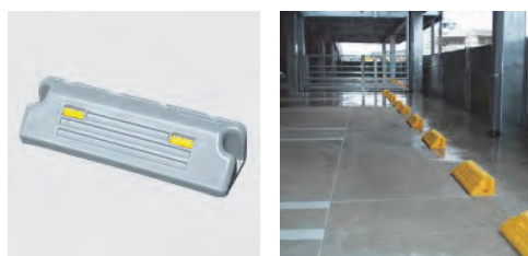
プラオートブロック

当社製自動車積載用 LED 非常信号灯は 2007 年第 20 回日刊自動車新聞用品大賞を受賞し、これまで累計 7 百万本納入、シェアは9割を超えます。今後は新車用標準装備品としての納入も増え市場需要の拡大が期待されています。また他にも鉄道用信号灯など特殊な LED 照明器具を供給している業界のリーディング企業です。