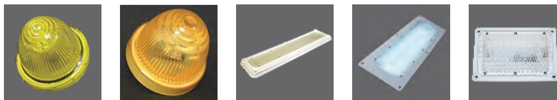
KB45マーカー LEDマーカー 庫内灯 庫内灯リニューアルタイプ 庫内灯 小型