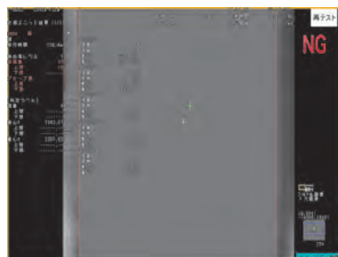
画像検査(検査画像例)