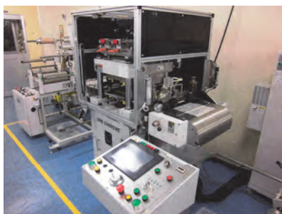
カメラ付プレス機