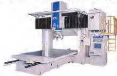
3次元5軸制御レーザー加工