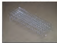
切削・接着組立/ PMMA(試験管トレイ)