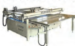
スクリーン印刷機「カリバー」