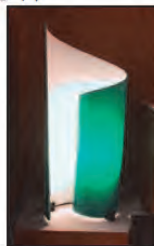
接着・切削・曲げ/ PMMA(照明器具用 セード)