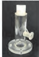
切削・接着組立/ PMMA(実験装置パーツ)