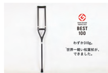
ドライカーボン松葉杖