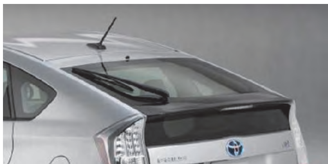
車両ガラス用黒色顔料