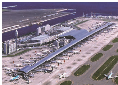
関西空港屋根塗料用顔料