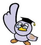
彩の国マスコット コバトン