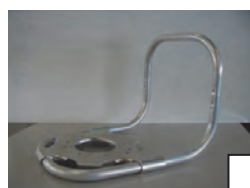
アルミ+アルミ 二重管