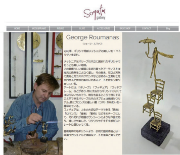
アテネのアート工房「SONATA GALLERY」 ブロンズの美しさ、繊細な作り込み、いつまでも見ていられる作品