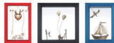
また逢いたくなるソナタの ハンドメイド&ブロンズ インテリア