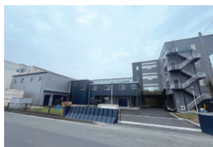
製造施設の増改築