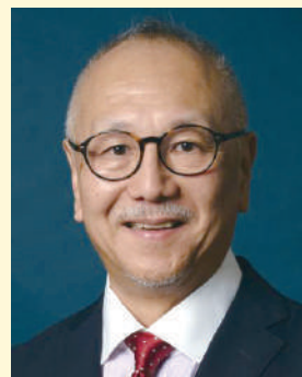
公益財団法人埼玉県産業振興公社

「県内中小企業の未来を創造する信頼できるパートナー」として、中小企業の皆様の更なる成長を目指し、職員一同、全力を尽くしてまいります。